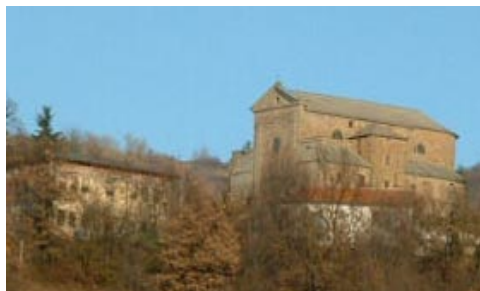
Susano, chiesa parrocchiale di S. Martino

Il 9 di novembre, infine, nella sala del circolo ACLI circa 120 persone si sono ritrovate per la tradizionale festa di S. Martino, patrono di Susano: S. messa, pranzo, musica, caldarroste, vin brulè e tombolata per tutti.