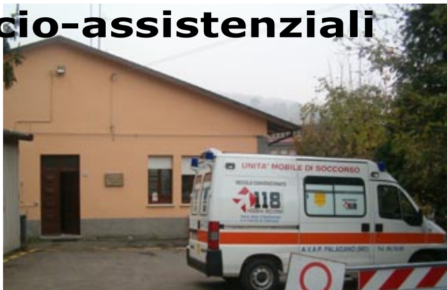
Palagano, "ex-asilo", attuale sede AVAP

Il consigliere delegato al sociale e alla sanità ci invia uno scritto in cui fa il punto della situazione sui servizi socio-assistenziali nel nostro comune