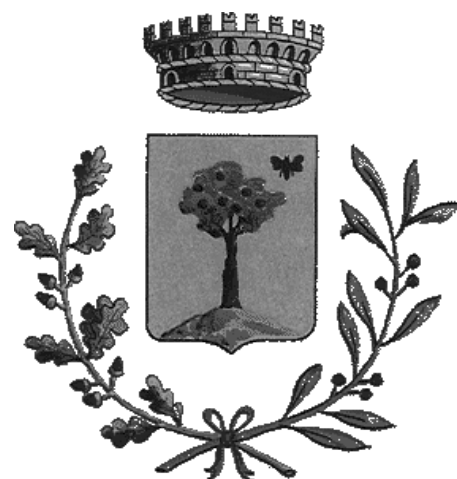
Stemma del Comune di Palagano

Il 28 marzo 2003 in Consiglio comunale è stato approvato il bilancio di previsione per l'anno 2003. Favorevoli i voti dei consiglieri di maggioranza, ad esclusione di un consigliere che si è astenuto; contrari i voti dei due gruppi di minoranza. I capigruppo della minoranza ci hanno inviato un loro "comunicato unitario" ritenendo opportuno comunicare agli abitanti del Comune di Palagano le motivazioni e il percorso che hanno portato alla scelta del voto contrario al bilancio e ai provvedimenti correlati. Precisiamo che, per equità, abbiamo più volte offerto un identico spazio al gruppo di maggioranza che, tuttavia, non ha ritenuto di rispondere. Pubblichiamo quindi solamente il "comunicato unitario" dei due gruppi di minoranza.