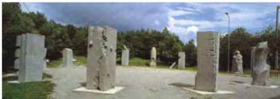
Monchio, Parco di Santa Giulia

Il 16 marzo, lo sci-club "Palagano" ha organizzato la propria gara sociale sulla pista "Belladonna" di Passo del Lupo; al termine di due combattutissime manche, crescentine per tutti in allegra scampagnata.