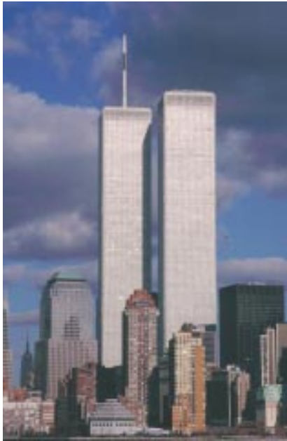
New York: le Twin Tower prima dell'attentato dell'11 settembre