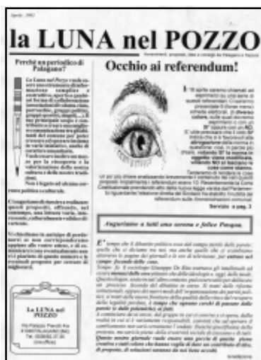
La copertina del primo numero de La LUNA nel pozzo (aprile 1993)

ma a Palagano; n° 8: Il caseificio di casa Conversi). E come non ricordare il suo ultimo articolo "Da don Bortolotti a don Galloni" ritrovato nel suo PC e pubblicato postumo nel numero di settembre 2000. Ed altri ancora ce ne avrebbe donati se la morte non lo avesse portato via.