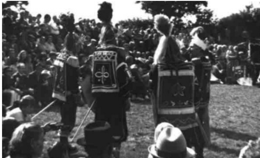
Rappresentazione del Maggio