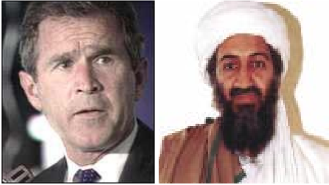
George Bush e Osama Bin Laden

Bè, secondo me l'America riscatta la plebe. Sono tutti plebei, in America. Bianchi, neri, gialli, marroni, viola, stupidi, intelligenti, poveri, ricchi. Però sono riscattati, perdio. E a questo mondo non c'è nulla di più forte, di più potente, della plebe riscattata. Ti rompi sempre le corna con la Plebe Riscattata. E con l'America le corna se le sono sem-