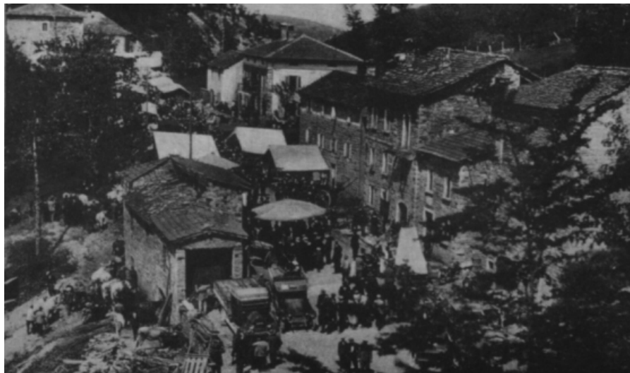
Antica fiera di Montemolino

Dopo la guerra del 1915-1918 vennero aperte in tutte le frazioni dell'appennino scuole elementari. Le lezioni spesso si svolgevano in locali di fortuna messi a disposizione da privati o parroci e, non sempre erano tenute da maestri, ma anche da persone non diplomate. Gli alunni quasi sempre di classi diverse venivano affidati ad un solo insegnante. Terminata la scuola elementare (terza classe), i ragazzi si univano ai genitori nel lavoro dei campi. Pochi riuscivano a continuare gli studi, soprattutto per motivi economici e per la necessità di doversi allontanare da casa per mesi. L'alfabetizzazione della popolazione non fu né completa né rapida. Analfabeti erano particolarmente gli anziani, ma anche molti ragazzi che, per lavorare nei campi o pascolare il bestiame, non potevano frequentare la scuola. Durante il ventennio fascista l'istruzione non migliorò un