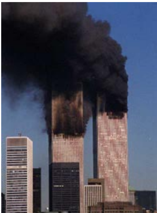
New York: 11 settembre 2001

La fecero con un foglio che insieme al bisogno dell'anima, il bisogno d'aver una patria, concretizzava la sublime idea della libertà anzi della libertà sposata all'uguaglianza. La Dichiarazione d'Indipendenza. E quel foglio che dalla Rivoluzione Francese in poi tutti gli abbiamo bene o male copiato, o al quale ci siamo ispirati, costituisce ancora la spina dorsale dell'America. La linfa vitale di questa nazione. Perché trasforma i sudditi in cittadini. Perché trasforma la plebe in Popolo. Perché la invita anzi le