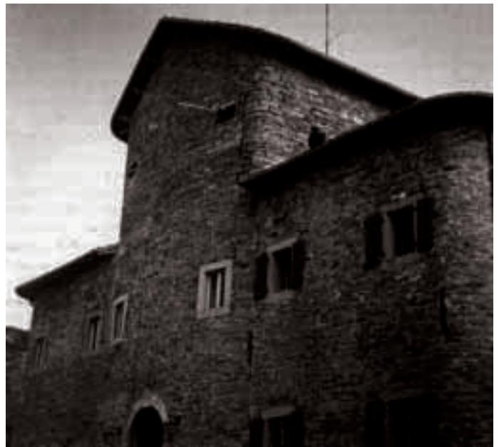
Palagano: Palazzo Sabbatini (Palazzo Pierotti)

Per creare posti di lavoro furono riaperte le miniere di Boccassuolo, creati cantieri per il rimboschimento, costruite nuove strade e scuole. Nel 1846 morì Francesco IV e gli successe il figlio Francesco V. Nel 1859 i moti rivoluzionari, che portarono all'unità d'Italia, lo costrinsero all'esilio e il Ducato di Modena-Reggio-Guastalla-Massa Carrara cessò di esistere e fu inglobato nel nuovo Regno d'Italia. Francesco V morì in Austria nel 1857 e con la sua morte si estinse la famiglia dei duchi d'Austria-Este.