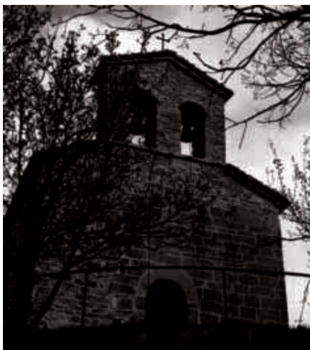
Monchio: Chiesa di S. Vitale, di origine medioevale, è stata restaurata nel 1990.

Oltrepassato il Passo della Radici la Bibulca discende in territorio toscano fino ad incontrare l'antico eremo ed ospizio di S. Pellegrino in Alpe, punto obbligato di passaggio e di sosta per secoli tra l'Appennino modenese e la Garfagnana, ancora immerso in una stupenda cornice di verdi e suggestive montagne, cuore di quella che era un tempo la tenebrosa ed inquietante "Selva Arimanesca".