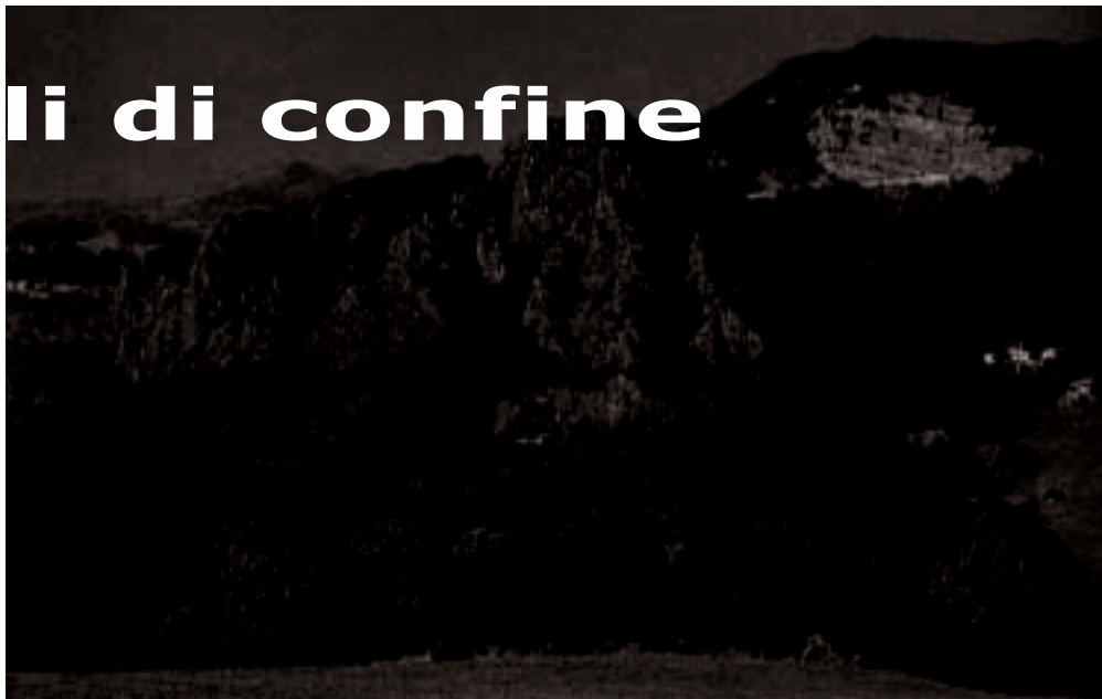
Valle del Dragone: le ofioliti di monte Calvario

Una proposta per scoprire emergenze architettoniche e naturalistiche poco conosciute nelle valli del Dragone e Dolo