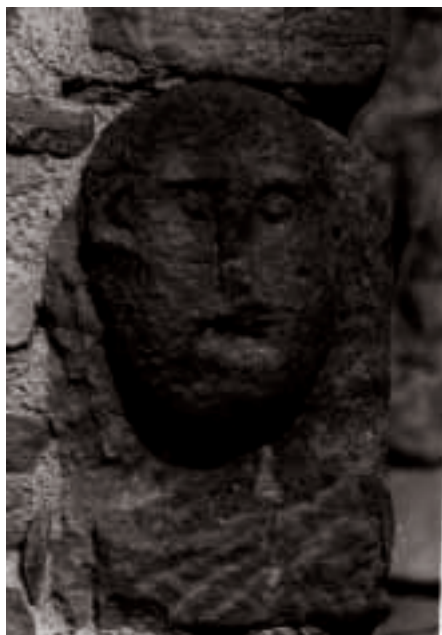
Palagano, località Casina: figura antropomorfa posta all'angolo della casa per allontanare gli "spiriti maligni".

Risalendo la valle del Dragone si incontra Costrignano con la chiesa di S. Margherita, ricostruita nel XIX secolo su progetto dell'architetto Vandelli, dove incastonata nella facciata si nota una formella di arenaria