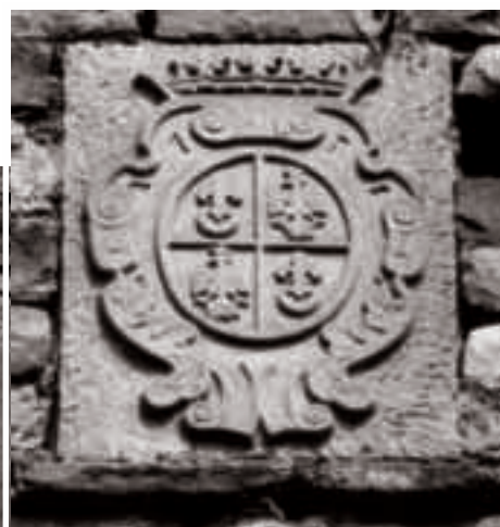
Palagano: stemmi della casa ducale estense (da sinistra: arco in una casa in località Aravecchia, Oratorio del Carmine)