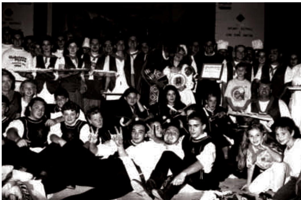
Palagano, 15 agosto 2000: conclusione della festa