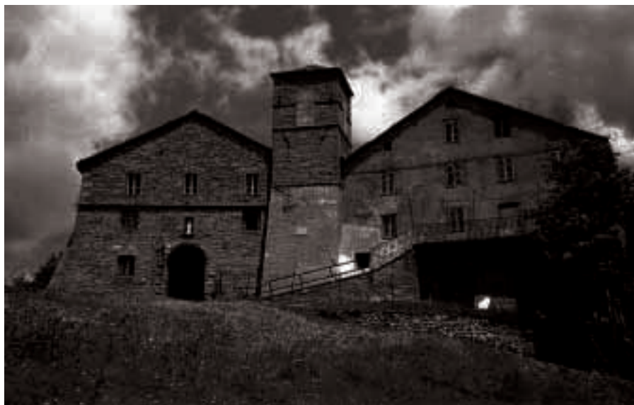
S. Pellegrino in alpe

Le ofioliti sono rocce vulcaniche nate da eruzioni sottomarine, che poi, con la nascita degli Appennini sono emerse, ed essendo più resistenti delle arenarie circostanti danno vita a queste particolari emergenze naturalistiche dalle forme e dai colori particola-